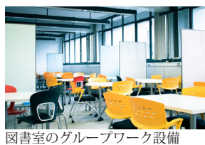
図書館のグループワーク設備

しました。学生の数も非常に多く、朝夕の多摩モノレールの駅の混雑ぶりには、今でも圧倒されております。一方で、そうした「規模の大きさ」の強みだと思いますが、図書館や経理研究所をはじめとする各種施設の充実ぶりにも驚かされました。また貸し出しPC 機器類や経済学部図書館にあるグループワーク用施設など、学生向けのインフラも相当程度整っているように見受けられます。このような環境のもとで、教育、研究活動に励むことができる今の環境を自分は素直に喜んでおります。