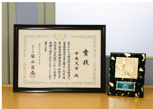
賞状と盾は経済学部事務室に飾ってあります。

二〇一九年度第一回 (通算二十五回) 日本語検定において、中央大学が文部科学大臣賞を受賞しました。経済学部生二十六名、法学部生一名の計二十七名が団体受験をし、その成績が優秀であったため今回の受賞となりました。受賞した学生は主に本学部の「入門 ICT 演習」「演習 2」の履修生です。「日本語」はコミュニケーションにおいて極めて重要なスキルと考え、積極的に本検定の受験を推奨した結果が今回の受賞につながりました。